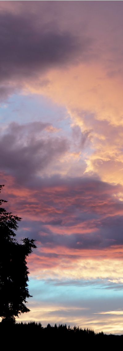
Manfred Roth Atrium Buchenuau

Beethoven Marathon 21. 5. 2023, 15.00 / 18.00