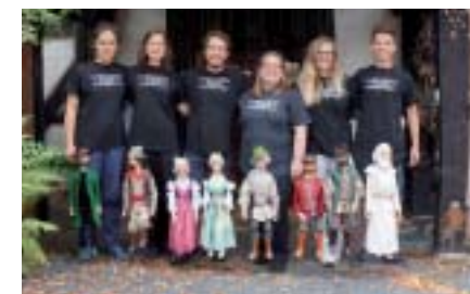
Das Ensemble des Marionettentheaters Schartenhof

So., 30. Oktober, 11.00 Uhr Matinee und 17.00 Uhr